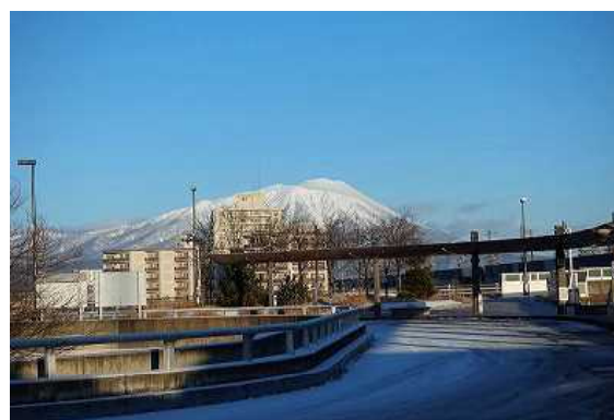
盛岡駅西口から岩手山を（早朝散歩の途中で）