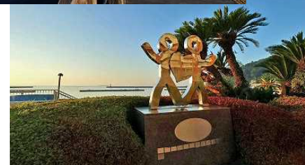
熱海サンビーチで早朝散歩