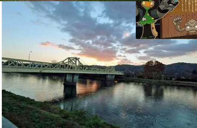
秋以降は 熊出没で自粛！！