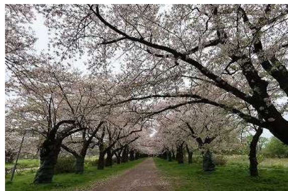
北上の展勝地近辺 年々桜の季節が早くなっています。