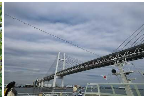
横浜港クルーズ マリンルージュ