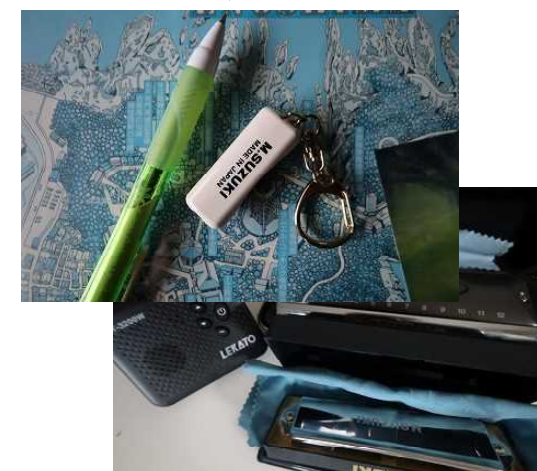
ウクレレの他にハーモニカも 上は ミニハーモニカ