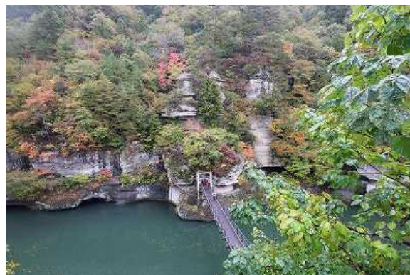
福島県 塔のへつり