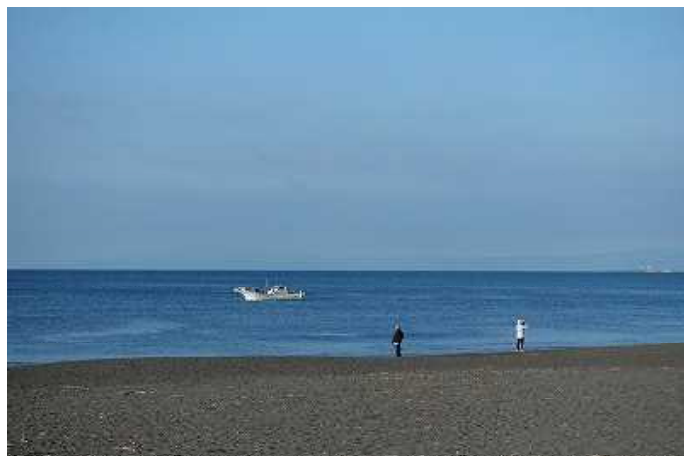
辻堂海岸 7千歩程度