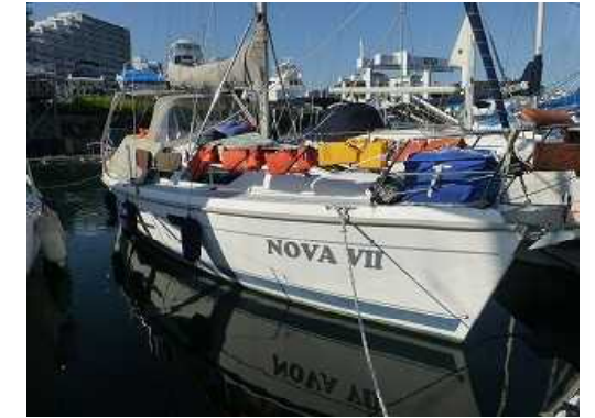
朝、来たら船が床上浸水？ 海水に浸かった装備品を洗って急遽物干し船に!!