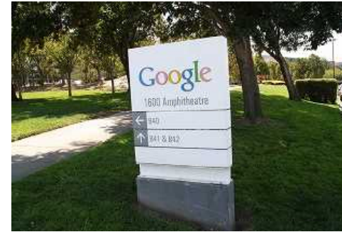
シリコンバレーを案内して頂く