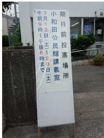
参議院選挙の期日前投票