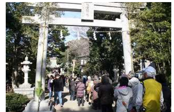
事務所近くの熊野神社で初詣