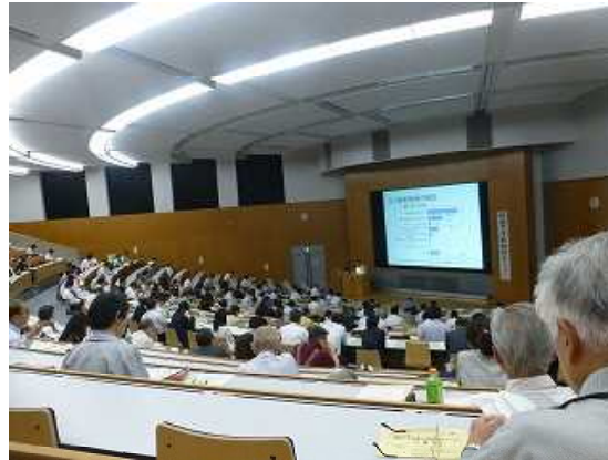
税務大学校でお勉強—和光市 遠い