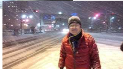
大荒れの盛岡 日本海側は豪雪 -忘年会が多かった