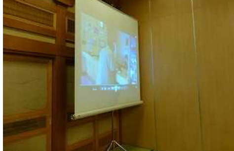
論文審査終了後の温泉—二年間を振り返って 3月