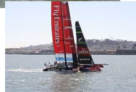
The 34th America's Cup in SF