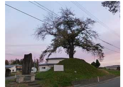
珍しい奥州街道・北上の成田一里塚 日本橋から 129里 (506Km) , 盛岡まで10里 (39Km)