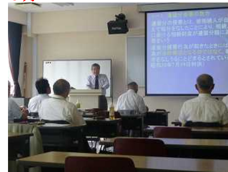
東北税理士会の夏期特別研修会 今回は午後のみ