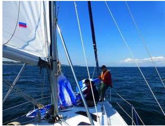
GW久しぶりのヨット-浦賀沖—あと何年出られるか？