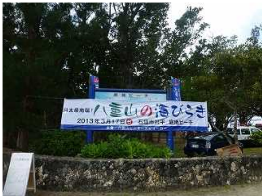
八重山の海開き—いつもお世話になります。 4月